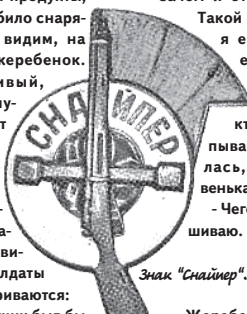
Знак "Снайпер". 1930-е годы

перской подготовки". На фронт были отправлены 1 885 девушек-снайперов, выпускниц школы. 180 из них погибли. Всего женская снайперская школа подготовила более тысячи снайперов и 407 инструкторов, на счету которых было около 12 тысяч немцев (почти дивизия вермахта). Девизом девушек-снайперов стало: "Лучше смерть стоя, чем жить на коленях!". Выпускницы снайперской школы в составе 3-го Белорусского фронта истребили более семи тысяч оккупантов. За время войны 102 девушки-снайперы удостоились ордена Славы третьей и второй степени, 7 - Красного Знамени, 7 - Красной Звезды, 7 - Отечественной войны, 229 - медали "За отвагу", 70 - "За боевые заслуги". Нагрудным знаком "Отличник РККА" были награждены 56 девушек.