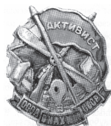
Знак "Активист ОСАВИАХИМ". 1928-1941 годы. Первый наградный знак оборонного обществва. Предназначал собой сочетание основных элементов его эмблемы.